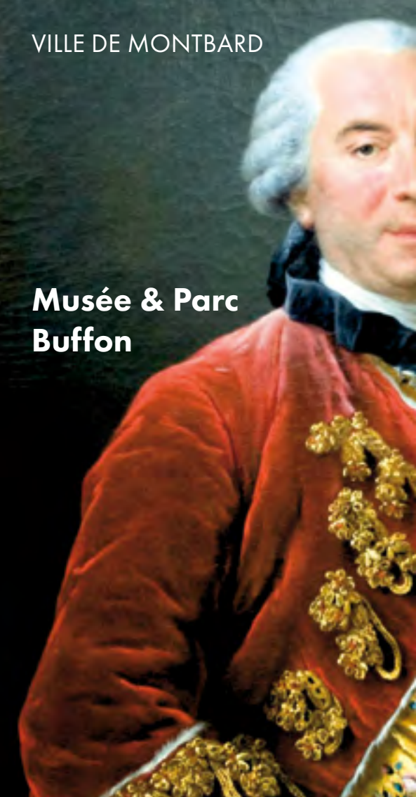
Portrait de Buffon par François-Hubert Drouais, 1763