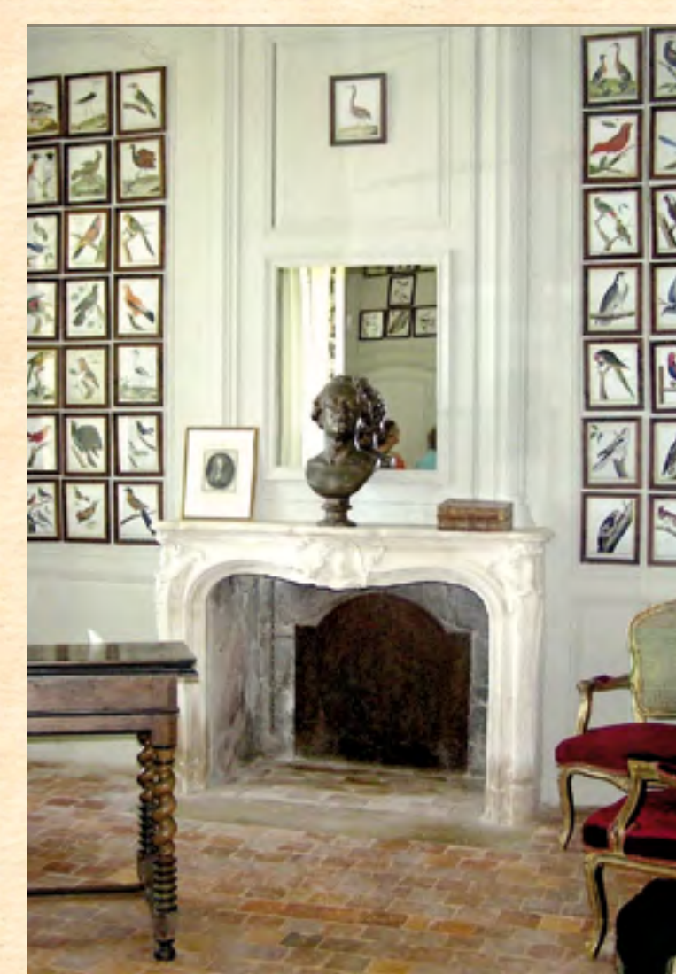
Vue intérieure du cabinet de travail de Buffon