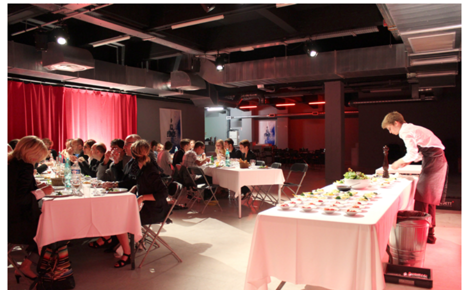
Salle de spectacles, capacité : 150 personnes assises - 350 debout