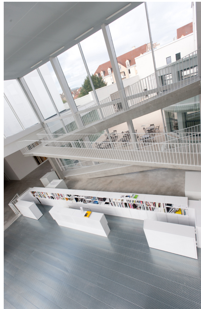
Hall d'accueil et espace librairie