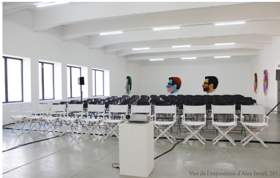
Salle d'exposition RDC, capacité : 50 à 150 personnes assises