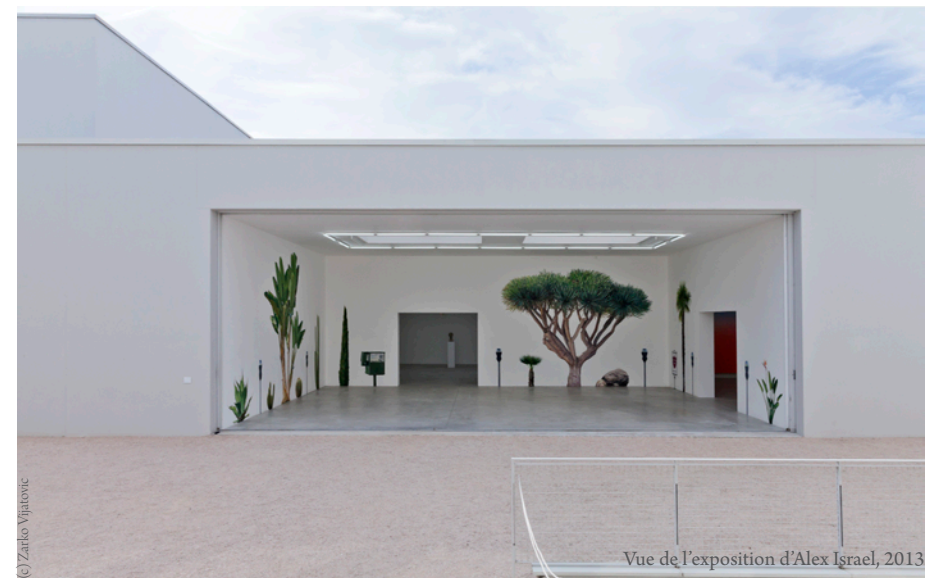
Salle d'exposition RDC, capacité : 50 personnes assises