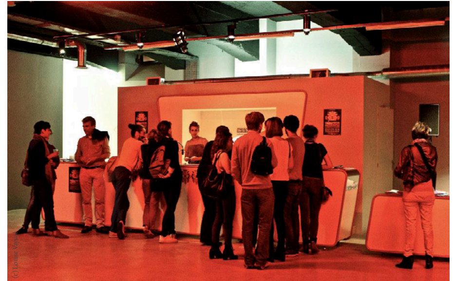
Bar de la salle de spectacles, capacité : 50 personnes debout ou assises