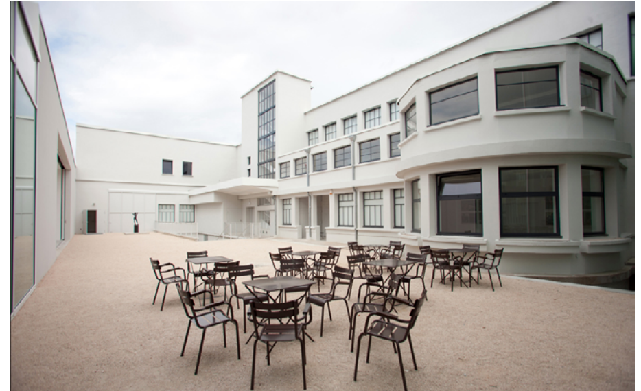
Cour intérieure, capacité : 200 personnes debout

Remarque : visibles par beau temps , les portes coulissantes s'ouvrent sur la cour de toute la hauteur et largeur de la salle.